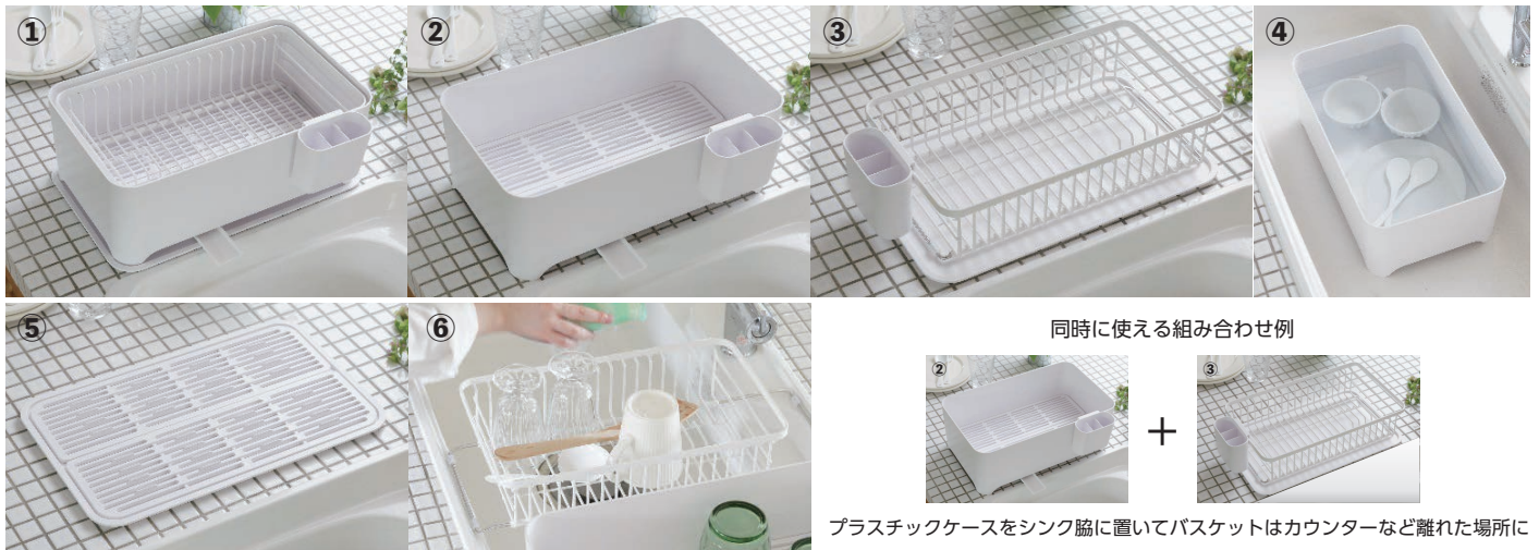
同時に使える組み合わせ例