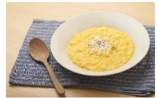
キャロットバタージュリゾット