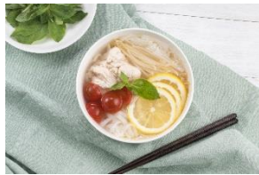
レモンたっぷりフォー