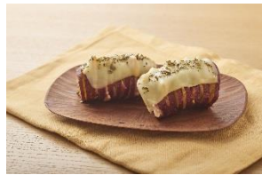
ベーコンチーズのバイクドスイートポテト