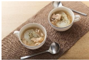
とろとろ新玉ねぎとツナのスープ