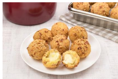
さつまいものコロコロコロッケ