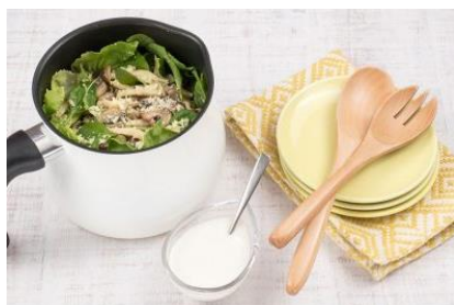
焼ききのこのサラダ ～ヨーグルトドレッシング～