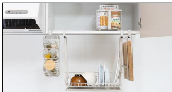
ルームラボ 吊り戸棚収納セット 販売価格：14,212円（税込）

その他、キッチン収納に便利なアイテムを取り揃えております。 詳しくは和平フレイズ公式HPで公開中です。HPは こちら