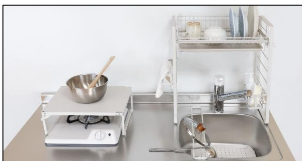
ルームラボ シンク・コンロ回り収納セット 販売価格：14,025円（税込）